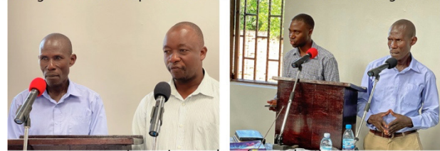
Increasing number of young brothers